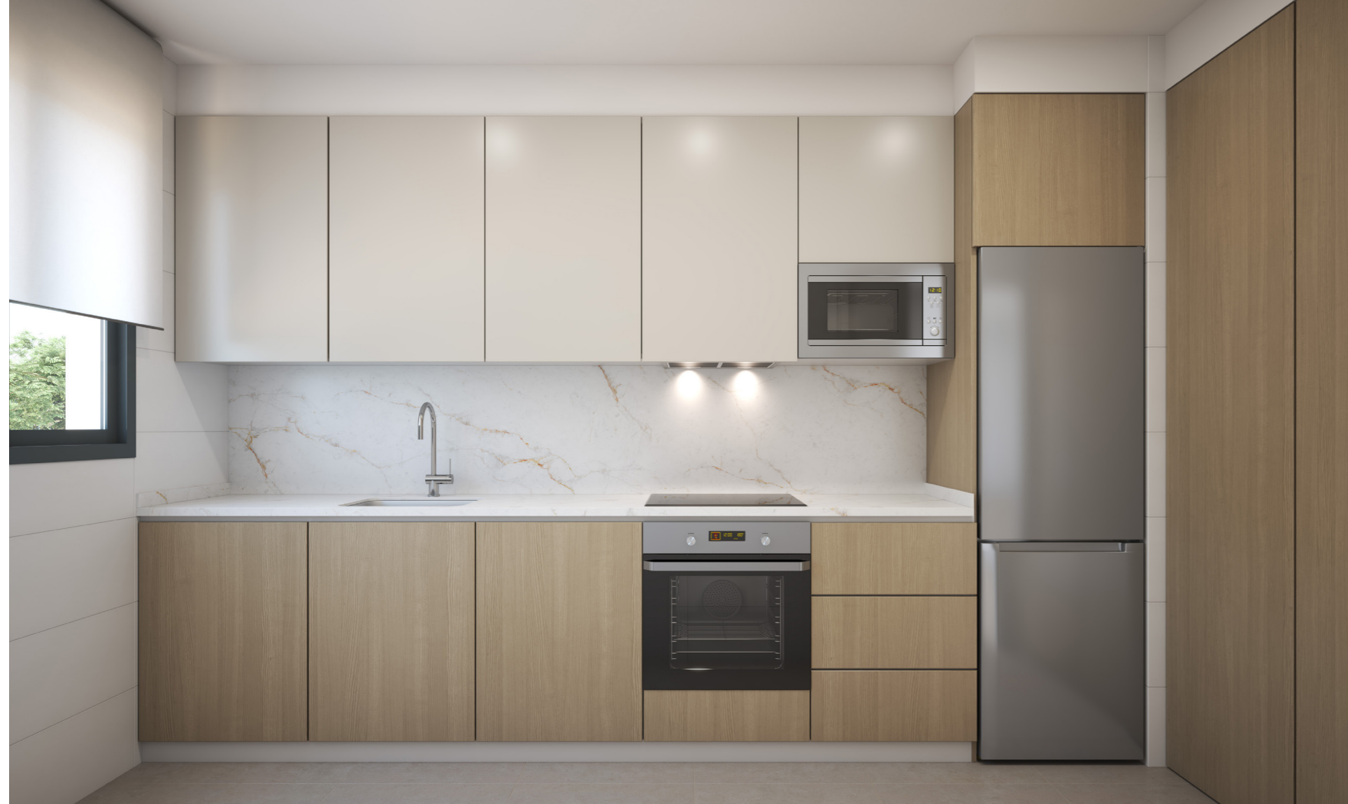
El frigorífico visible en la imagen tiene carácter decorativo y no está incluido en el equipamiento estándar. Opciones de personalización disponibles bajo consulta y coste adicional.